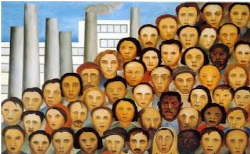
Tarsila do Amaral - Operários