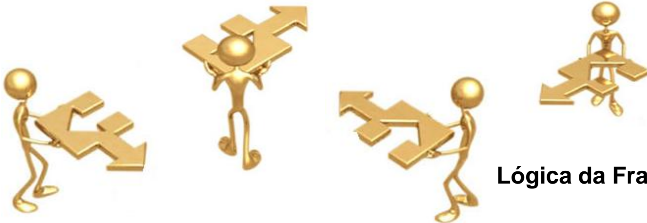
Lógica da Fragmentação