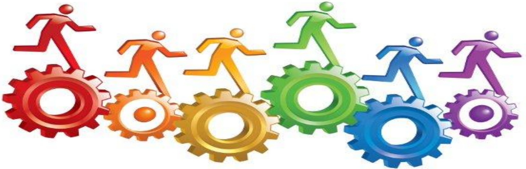
Lógica da Cobertura Integral